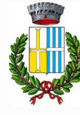
Comune di Villafranca Padovana