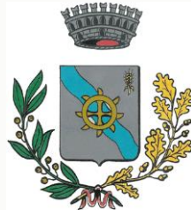
Comune di Campo San Martino