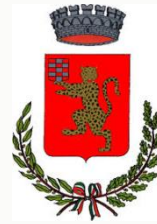
Comune di Limena