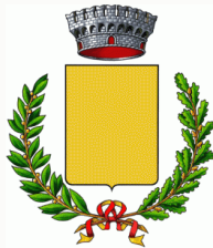
Comune di Campodoro