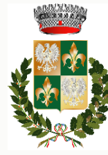
Comune di Piazzola sul Brenta